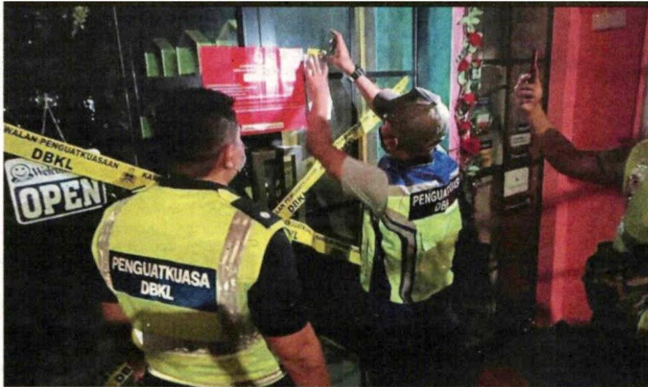
DBKL enforcement officers sealing off one of the 41 premises for failing to comply with the SOP.