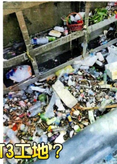
作。 水灾发生时，许多垃圾「卡」在水泵，导致水泵发热、难以操