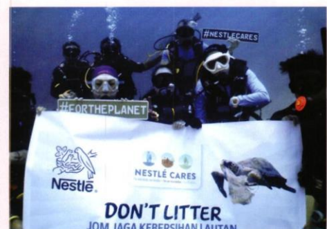
Nestlé's first underwater clean-up in Sepanggar Island, Sabah

"Protecting the planet is a shared responsibility. Nature has provided us with an abundance of resources that we have in some ways collectively taken for granted and often squandered. It is this generation's obligation to stop adding more damage to nature and to explore all possible ways to restore the damage done. We owe it to our children and to all next generations to come," concluded Aranols.