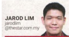
JAROD LIM jarodlim @thestar.com.my