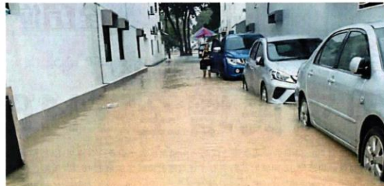
一场长命雨，导致高阳苑水淹1尺高，还掺杂黄泥水。