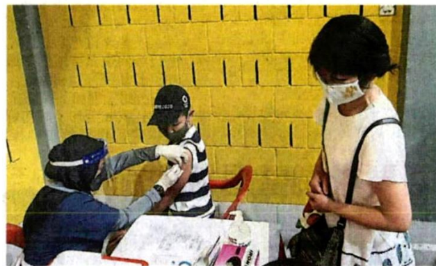
■雪州政府将启动“雪州青少年冠病疫苗接种计划”。