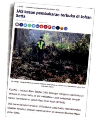
JAS Selangor mengesan pembakaran terbuka dekat Kampung Johan Setia.

Menurut JAS, koordinat lokasi kebakaran diambil bagi mengenal pasti pemilik tanah yang menyebabkan atau membenarkan pembakaran itu dan kes dirujuk kepada PDT Klang untuk siasatan lanjut.