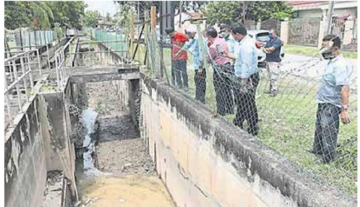
■巴生多个地区水灾后，查尔斯（左二）等人立即安排实地勘察，以了解个别地区的水灾肇因。

(巴生22日讯) 周三下午连续下了一场5小时连绵不断的大雨，且遇上涨潮，导致巴生多个住宅区或道路闪电水灾。惟巴生国会议员查尔斯却不排除还有其他肇因，对此走访各个水灾区，以寻找出水灾恶化因素，并向巴生市议会提出多项对症下药建议。