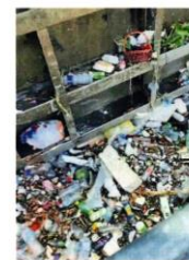
许多垃圾“卡”在水泵，导致水泵发热，难以操作。

委员会、雪州水利灌溉局等相关单位，立即安排一场县级灾难委员会特别会议，以便讨论日后如何防止大水灾再度发生。