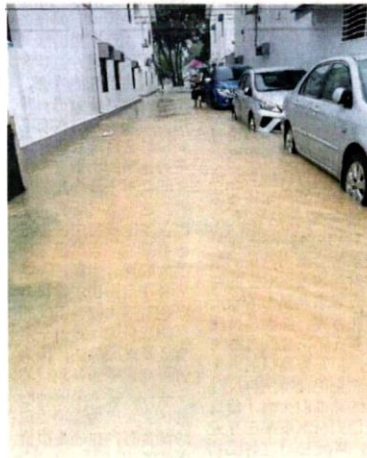
泥水。 周三一场长命雨，导致高阳苑水淹1尺高，还掺杂黄