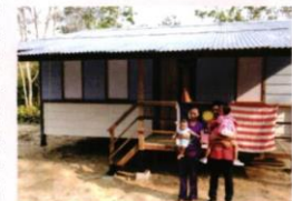
A family home using Project CAREton roofing tiles made from recycled drink packs

Established in 2012, MILO® UHT collaborated with Tetra Pak® to launch the CAREton Project to collect used beverage cartons (UBCs) to be recycled into 'green' roofing tiles and panel boards for the community. Since its establishment, nearly 200 million drink packs have been collected and upcycled. As an example, the different elements of the packs are separated and converted into roofing tiles and panel boards that are used to build homes for Orang Asli communities partnering with EPIC Homes, as well as for community projects in Johor and Selangor.