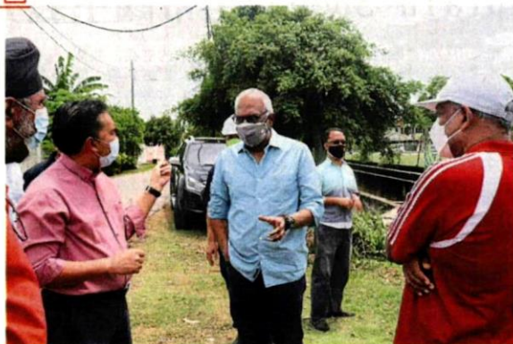
查尔斯(中)向官员们了解巴生周三大水灾的肇因。

他指出，当地也将在丹绒路(Jalan Tanjung)兴建一座防洪池、提升该花园一带的排水沟等，预料明年4、5月动工，工程需时约18个月。