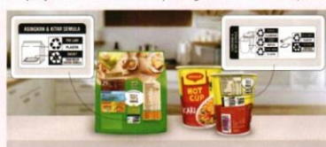
More than 80% of Nestlé product packaging already features on-pack recycling guidelines

The Company has already achieved important breakthroughs. This includes implementing 100% paper straws across its entire UHT range, making Nestlé Malaysia the first large-scale food and beverage company in ASEAN to do so and phasing out over 200 million plastic straws per year in Malaysia.