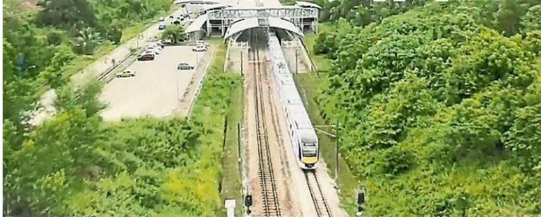
(摘自市议会脸书直播) 双文井将成为我国的交通装配枢纽中心。

(乌雪22日讯)雪州大臣拿督斯里阿来鲁丁表示,配合2035年发展结构大蓝图重整而成的双文井双溪珠—武吉柏伦东汽车工业区,不仅能让外资信心大增,也将推动乌雪市成为国家交通装配枢纽中心。