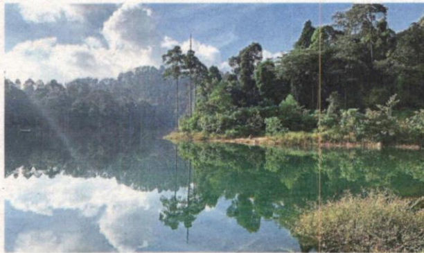
The mirror lake, known for its crystal-clear water, is one of the attractions at Shah Alam Community Forest.

Conservation group SACF Society, however, found that there were no notifications in the Selangor government gazette to about SACF being degazetted, hence it should still hold a forest