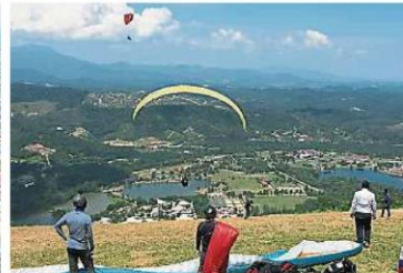
左图:乌雪市行政中心新古毛是雪州首个城市花园区。