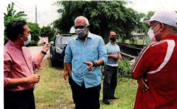
查尔斯 (中) 向官员们了解巴生周三大水灾的肇因。

他指出，当地也将在丹绒路兴建一座防洪池，提升该花园一带的排水沟等，预料明年 4、5 月动工，工程历时约 18 个月。