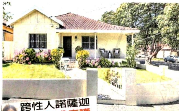
于角落的单层独栋屋子。诺萨迦在澳洲坎特伯里的新家，是位

她日前在社交媒体直播时透露，她已售在马来西亚的所有生意，并打算在澳洲重新生活及做生意；她也否认此举是逃跑，而是迁移(hijrah)。